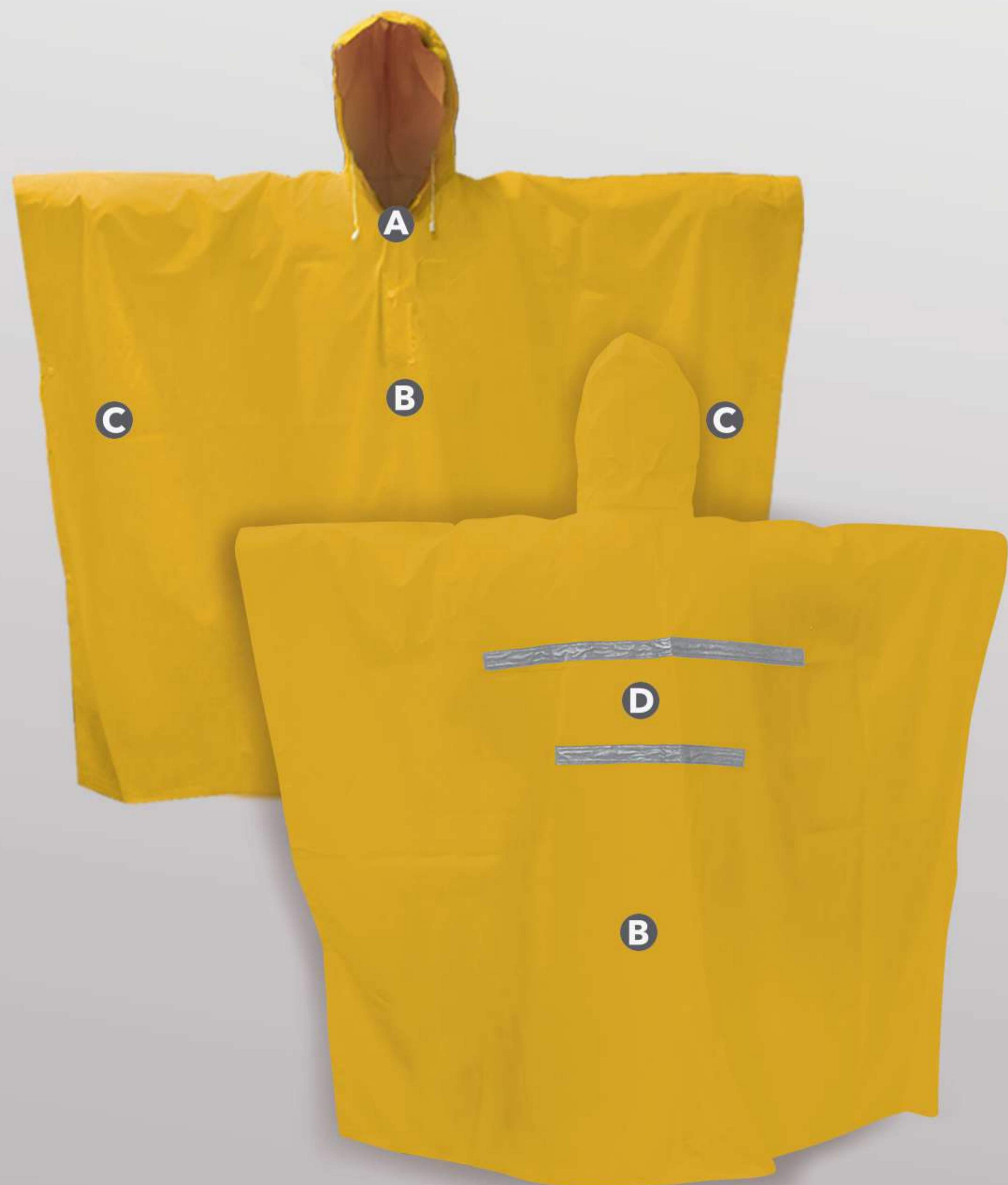
IMPERMEABLE TIPO CAPAMANGA CON REFLEJANTES